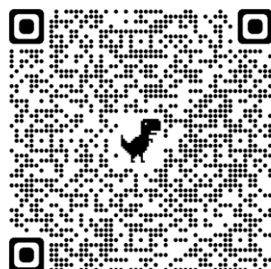
Portal de Escolarización